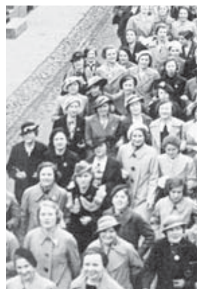
Firmenmitglieder von Beckers & Le hantieren auf dem Weg zur Maifeier 1936.

Es ist in der Buchhandlung Dietsch erhältlich und kostet 19,80 Euro. Auflage: 2000 Stück, erschienen im Emons-Verlag.