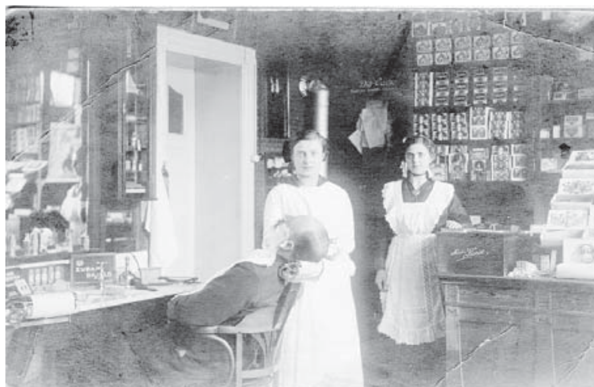
Der „ Herrensalon “ für moderne Haar- und Bartpflege mit einer Innenansicht (Urdenbacher Dorfstraße) ist im Buch abgebildet. Er war dort, wo heute die Bäckerei Pass eine Filiale hat.