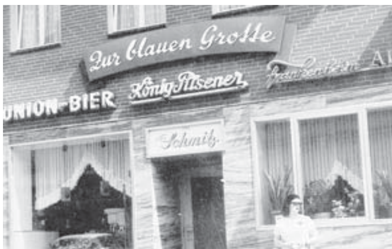
„Zur blauen Grotte“ hieß die Gaststätte an der Urdenbacher Dorfstraße , die heute als „Alt Urdenbach“ bekannt ist.